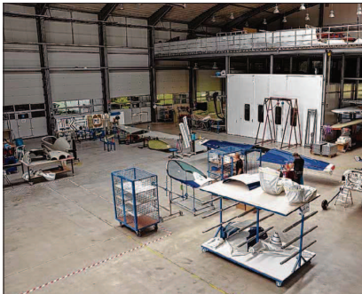
In diesem Hangar neben der Start- und Landebahn des Flughafens werden die leichten Flieger gebaut.